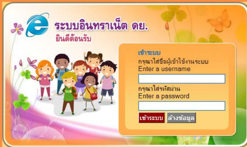
รูปที่ 1 หน้าระบบอินเทอร์เน็ต ดย.