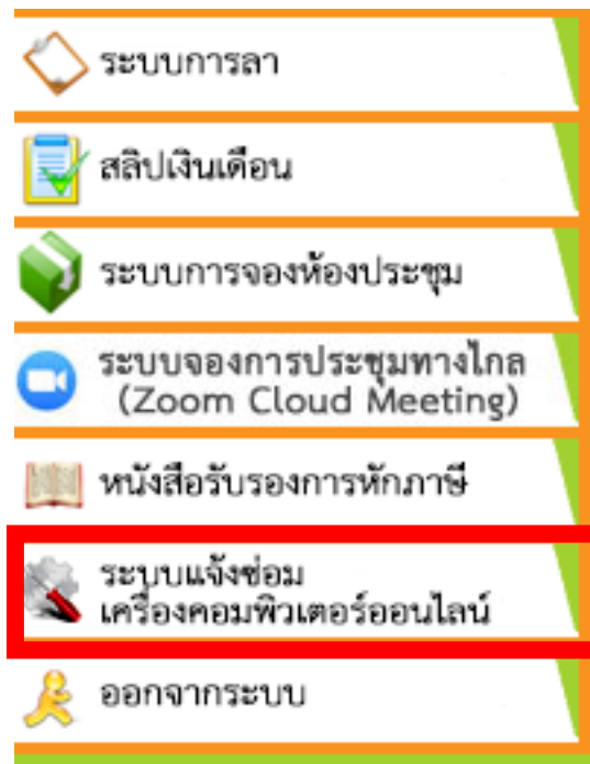
รูปที่ 2 แถบหน้าแรก เลือกระบบแจ้งซ่อมเครื่องคอมพิวเตอร์ออนไลน์